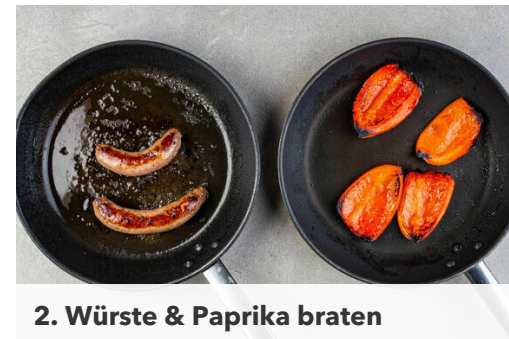
2. Würste & Paprika braten

Die Paprika vierteln und entkernen. Die Estragonblätter von den Stängeln zupfen. Ggf. den Grill vorheizen. 2EL Butter beiseitestellen und Raumtemperatur annehmen lassen.