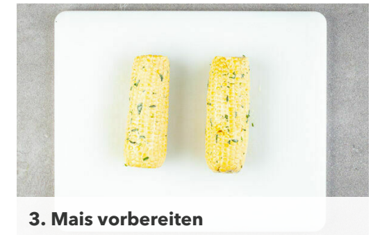
3. Mais vorbereiten

Die Würste mit einer Gabel einstechen, in eine große Pfanne oder ggf. auf den Grill geben und bei mittlerer bis starker Hitze in 8-10Min. rundum goldbraun und gar braten. Inzwischen die Paprika in einer zweiten großen Pfanne mit 1EL Olivenöl bei mittlerer bis starker Hitze 5-7Min. braten, bis sie weich und leicht geschwärzt ist, dabei mehrmals wenden.