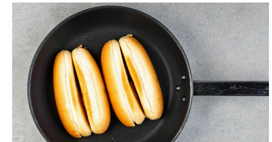
6. Füllen und servieren

Die Paprika aus der Pfanne nehmen, in kleine Würfel schneiden und mit dem restlichen Estragon , 2EL Essig, 1-2EL Zucker und 1/2-1TL Salz vermengen. Die 1/2 des Fetas über dem Relish zerkrümeln. Mit Salz und Pfeffer abschmecken.