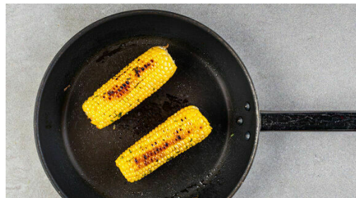
4. Mais braten

Die Hüllblätter und Fäden von den Maiskolben entfernen. Die warme Butter mit der 1/2 des Estragons vermengen und auf die Maiskolben streichen.