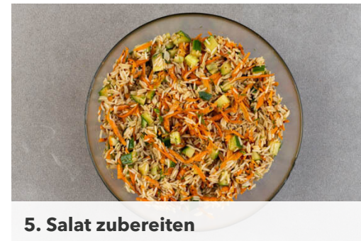
5. Salat zubereiten

Die Mandelblättchen in einer großen Pfanne ohne Zugabe von Fett bei mittlerer Hitze 1-2Min. goldbraun anrösten. Vorsicht , sie können schnell zu dunkel werden. Zum Abkühlen aus der Pfanne nehmen und beiseitestellen.