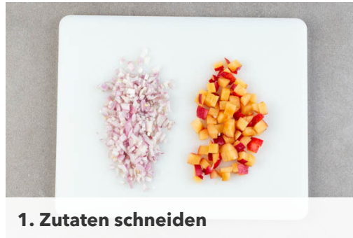
1. Zutaten schneiden

Energie 881kcal, Fett 42.3g, Kohlenhydrate 82.7g, Eiweiß 39.7g