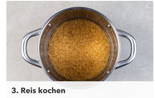
3. Reis kochen

Die Schalotten und die Pflaumen in einem kleinen Topf mit 2EL Butter bei mittlerer Hitze 2-4Min. braten, dann die Balsamicocreame , 4EL Balsamicoessig, 80ml Wasser und 1TL Honig hinzufügen. Bei mittlerer bis niedriger Hitze 12-15Min. einköcheln lassen, bis eine marmeladenartige Konsistenz erreicht ist. Ggf. mehr Wasser hinzufügen, falls die Sauce zu dickflüssig wird.