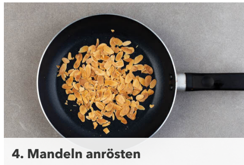
4. Mandeln anrösten

Den Reis in das kochende Wasser geben und abgedeckt bei niedrigster Hitze 8-10Min. kochen, bis das Wasser aufgesogen und der Reis gar ist, dann in einem Sieb mit kaltem Wasser abspülen und abtropfen lassen.