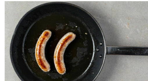
5. Würste braten

Den Brokkoli in mundgerechte Röschen zerteilen und in dem zweiten Topf in 2-3Min. bissfest kochen. Ebenfalls abgießen und kalt abschrecken.