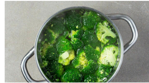
2. Brokkoli kochen

Die Sonnenblumenkerne in einer mittelgroßen Pfanne ohne Zugabe von Fett bei mittlerer bis starker Hitze 3-5Min. anrösten, bis sie leicht gebräunt sind. Aus der Pfanne nehmen und auf einem Teller beiseitestellen.