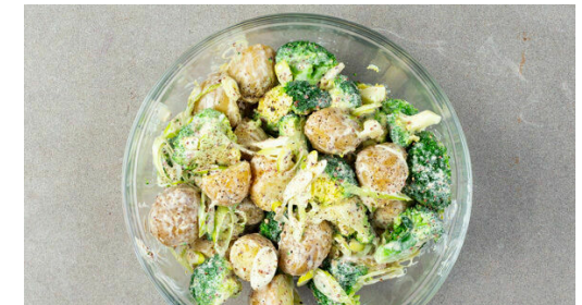
6. Salat fertigstellen

Die Lauchzwiebeln schräg in feine Ringe schneiden. Den Joghurt mit dem Senf , 4EL Mayonnaise sowie je 4EL Olivenöl und Essig verrühren und das Dressing mit Salz und Pfeffer abschmecken.