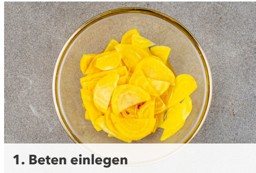
1. Beten einlegen

Energie 869kcal, Fett 47.2g, Kohlenhydrate 66.9g, Eiweiß 38.8g