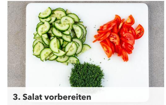
3. Salat vorbereiten

Die Kapern grob schneiden. Den Käse fein reiben und mit den Kapern , 2EL Mayonnaise, 3EL Olivenöl, 3EL Wasser, 2TL Essig und je 1/2TL Salz und Pfeffer in einem hohen Gefäß mit einem Stabmixer fein pürieren. Ggf. löffelweise Wasser zugeben, bis die gewünschte Konsistenz erreicht ist.