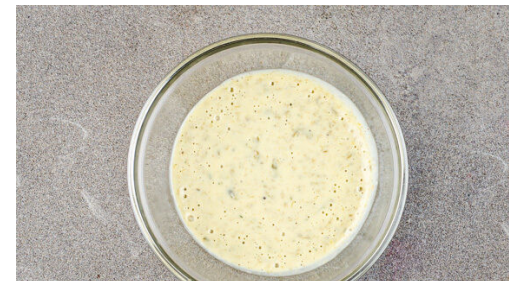
5. Dressing pürieren

Den Bulgur und die Gewürzmischung in den ersten mittelgroßen Topf mit dem kochenden Wasser rühren und abgedeckt bei niedriger Hitze 8-10Min. sanft köcheln lassen, bis das Wasser aufgesaugt und der Bulgur gar ist. Noch ca. 5Min. ohne Hitzezufuhr ziehen lassen.