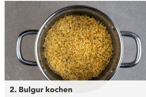
2. Bulgur kochen

Das Hackfleisch gründlich mit 2EL Senf sowie je 1/2TL Salz und Pfeffer verkneten und zu 16 walnussgroßen Hackbällchen formen. Die Hackbällchen in einer großen Pfanne mit 1EL Olivenöl bei mittlerer bis starker Hitze in 8-10Min. rundum goldbraun und gar braten.