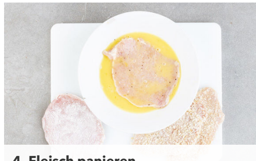
4. Fleisch panieren

In einem kleinen Topf 400ml leicht gesalzenes Wasser zum Kochen bringen. Den Reis in einem Sieb kalt abspülen, bis das Wasser klar bleibt. Sobald das Wasser kocht, den Reis hineingeben und abgedeckt bei niedrigster Hitze 10-12Min. kochen, bis das Wasser aufgesogen und der Reis gar ist. Noch ca. 5Min. ohne Hitzezufuhr ziehen lassen.