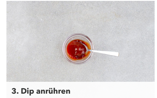
3. Dip anrühren

Die Tonkatsu in einer mittelgroßen Pfanne mit 2EL Pflanzenöl bei mittlerer bis starker Hitze auf jeder Seite 2-3Min. knusprig braten.