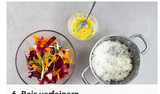
6. Reis verfeinern

Die Sriracha-Sauce mit 1EL Ketchup verrühren.