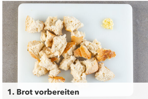
1. Brot vorbereiten

Energie 694kcal, Fett 47.6g, Kohlenhydrate 40.8g, Eiweiß 25.1g