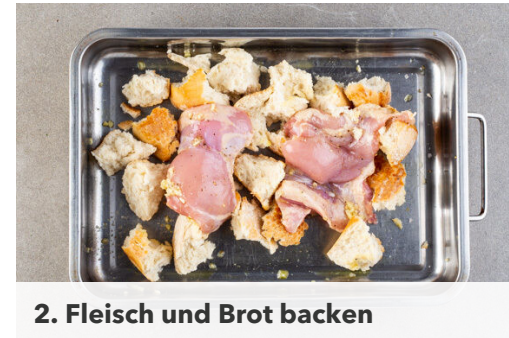
2. Fleisch und Brot backen

Den Backofen auf 220°C (200°C Umluft) vorheizen. Das Brot in grobe Stücke zerteilen. Den Knoblauch schälen und grob würfeln.