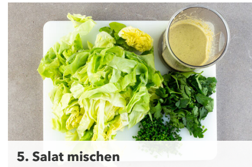
5. Salat mischen

Das Fleisch und die Croûtons aus dem Ofen nehmen, die Croûtons beiseitestellen. Den Ofen auf Grillfunktion umstellen oder auf 240°C Ober-/Unterhitze und das Fleisch 5-10Min. grillen, bis es knusprig ist. Nach der Hälfte der Zeit wenden.