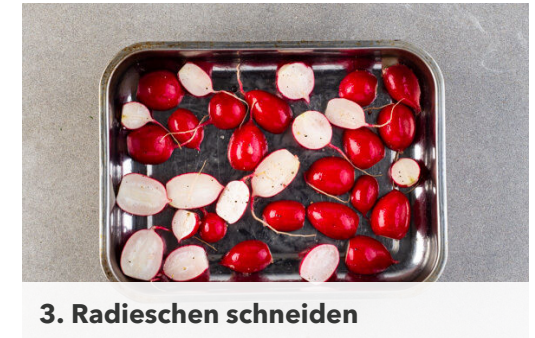
3. Radieschen schneiden

Das Brot in eine Auflaufform geben und den Knoblauch darüber verteilen. Das Fleisch trocken tupfen, mit 1EL Olivenöl sowie Salz und Pfeffer einreiben und auf das Brot legen. Im Ofen ca. 20Min. backen, bis das Fleisch gar und das Brot knusprig ist, dabei nach der Hälfte der Zeit wenden.