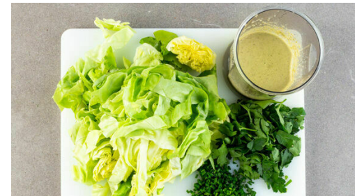
5. Salat mischen

Das Fleisch und die Croûtons aus dem Ofen nehmen, die Croûtons beiseitestellen. Den Ofen auf Grillfunktion umstellen oder auf 240°C Ober-/Unterhitze und das Fleisch 5-10Min. grillen, bis es knusprig ist. Nach der Hälfte der Zeit wenden.