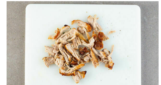
6. Fleisch zerteilen

Den Salat in Streifen schneiden. Die Petersilie ohne harte Stängel grob hacken, den Schnittlauch in feine Ringe schneiden. Die Kapern mit dem Senf , 3EL Mayonnaise, 2EL Olivenöl, 2EL Essig, 3EL Wasser und 1 kräftigen Prise Pfeffer in einem hohen Gefäß mit einem Stabmixer fein pürieren. Das Kaperndressing ggf. mit Salz abschmecken und mit dem Salat vermengen.