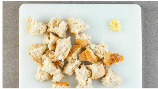
1. Brot vorbereiten

Energie 549kcal, Fett 39.9g, Kohlenhydrate 25.0g, Eiweiß 22.1g