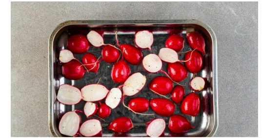
3. Radieschen schneiden

Das Brot in eine Auflaufform geben und den Knoblauch darüber verteilen. Das Fleisch trocken tupfen, mit 2EL Olivenöl sowie Salz und Pfeffer einreiben und auf das Brot legen. Im Ofen ca. 20Min. backen, bis das Fleisch gar und das Brot knusprig ist, dabei nach der Hälfte der Zeit wenden.