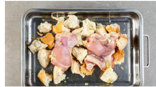
2. Fleisch und Brot backen

Den Backofen auf 220°C (200°C Umluft) vorheizen. Das Brot in grobe Stücke zerteilen. Den Knoblauch schälen und grob würfeln.