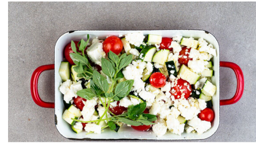
2. Gemüse und Feta backen

Die Pasta in das kochende Wasser geben und in 8-10Min. bissfest kochen. 250ml Pastawasser abschöpfen, dann die Pasta in ein Sieb abgießen und abtropfen lassen.