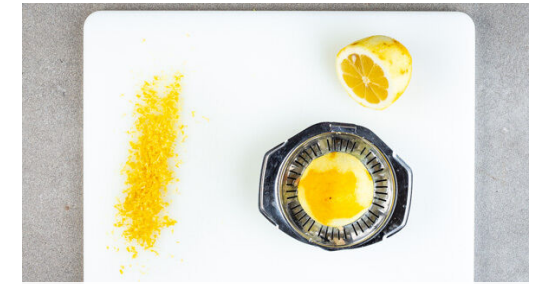
3. Zitrone vorbereiten

Die Walnüsse in einer kleinen Pfanne ohne Zugabe von Fett bei mittlerer Hitze 1-2Min. anrösten. Vorsicht , sie können schnell zu dunkel werden. Aus der Pfanne nehmen und kurz abkühlen lassen. Die Basilikumblätter abzupfen und mit den Walnüssen sowie der Zitronenschale fein hacken, dann mit 2TL Olivenöl vermengen. Die Gremolata mit je 1 Prise Salz und Pfeffer würzen.