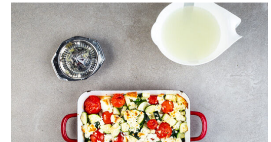
6. Fertigstellen & servieren

Die Zitronenschale abreiben, dann die Zitrone halbieren und auspressen.