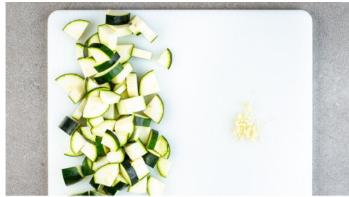
1. Gemüse schneiden

Energie 917kcal, Fett 50.6g, Kohlenhydrate 87.7g, Eiweiß 27.5g