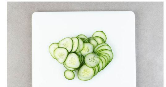
6. Gurke schneiden

Die Hackmasse in 16 gleich große Kugeln formen, dazu am besten die Hackmasse in 2 Portionen teilen und jede Portion wiederum teilen, bis die gewünschte Anzahl erreicht ist. Die Hackkugeln leicht flach und in eine ovale Form drücken, dann in einer großen Pfanne mit 2EL Olivenöl bei mittlerer bis starker Hitze auf jeder Seite 2-3Min. braten, bis das Fleisch gar und goldbraun ist.