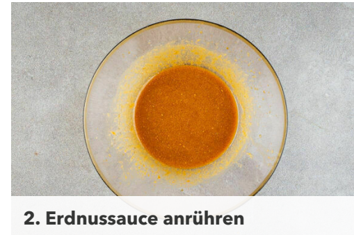
2. Erdnussauce anrühren

Das Fleisch trocken tupfen und in 2-3cm dicke Streifen schneiden. Das Fleisch , die 1/2 der Karotten und die 1/2 des Selleries in einer großen Pfanne mit 2EL Pflanzenöl bei starker Hitze 6-7Min. unter Rühren braten, bis das Fleisch gar und goldbraun ist. Mit 1/2TL Salz würzen.