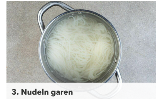
3. Nudeln garen

Das Fleisch mit dem angebratenen Gemüse , den Nudeln , den restlichen Karotten , der 1/2 der Gurkenscheiben und der Erdnussauce vermengen.