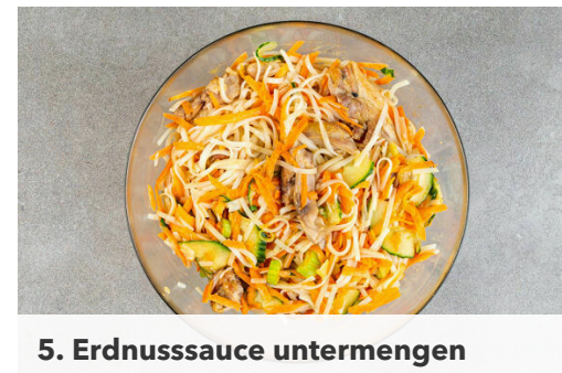
5. Erdnussauce untermengen

Den Knoblauch , die Sojasauce , die Erdnussbutter , 4EL Pflanzenöl, 4EL Essig und 3TL Honig verrühren.