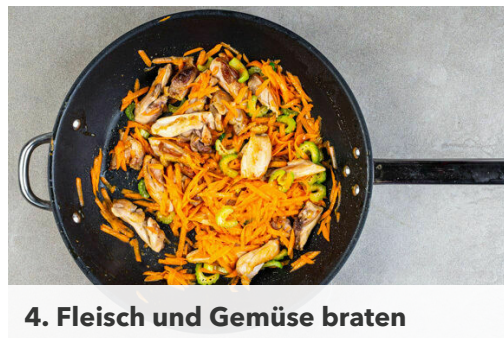
4. Fleisch und Gemüse braten

In einem großen Topf ausreichend gesalzenes Wasser für die Nudeln zum Kochen bringen. Den Knoblauch schälen und fein reiben, die Gurke in dünne Scheiben hobeln. Die Karotten ggf. schälen und grob raspeln. Die Lauchzwiebeln in feine Ringe schneiden. Den Sellerie quer in dünne Scheiben schneiden.