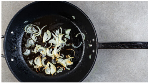
1. Zwiebeln braten

Energie 935kcal, Fett 42.8g, Kohlenhydrate 103.1g, Eiweiß 33.6g