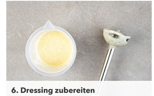
6. Dressing zubereiten

Das Fleisch in derselben Pfanne mit 1EL Olivenöl bei mittlerer bis starker Hitze auf jeder Seite 4-5Min. braten, bis es gar ist. Das Fleisch anschließend in dünne Streifen schneiden.