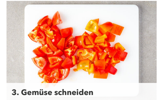
3. Gemüse schneiden

Den Mais in ein Sieb abgießen und abtropfen lassen. 2-3EL Mais separat beiseitestellen. Den Knoblauch schälen und grob würfeln.