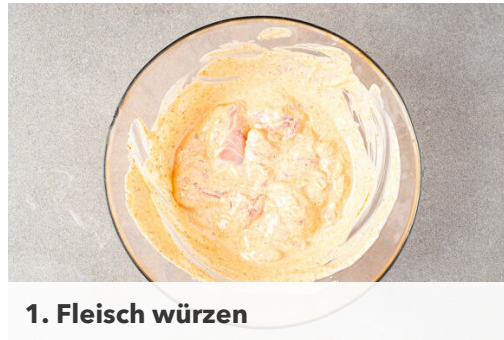
1. Fleisch würzen

Energie 869kcal, Fett 65.2g, Kohlenhydrate 32.0g, Eiweiß 39.4g