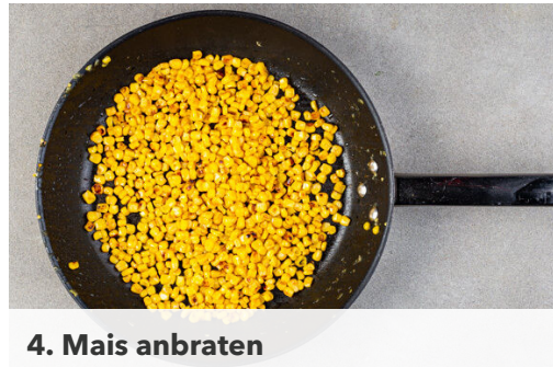
4. Mais anbraten

Die Paprika vierteln, entkernen und in 1-2cm große Stücke schneiden. Die Tomaten vierteln und ebenfalls in 1-2cm große Stücke schneiden.