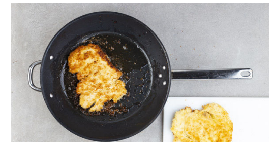
6. Schnitzel braten

Die Cranberrys in ein Sieb abgießen, das Einweichwasser auffangen. Die abgetropften Cranberrys sehr fein hacken und mit 4EL Tomatenketchup verrühren, nach Bedarf etwas Einweichwasser hinzugeben.