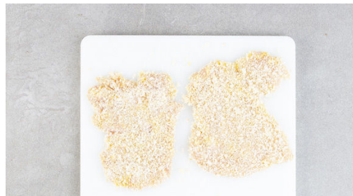
4. Schnitzel panieren

Den Brokkoli in 2-3cm kleine Röschen schneiden. Die Karotten ggf. schälen und in dünne Scheiben schneiden. Das Gemüse in das kochende Wasser geben und in 4-6Min. bissfest kochen. Ca. 1 Tasse Kochwasser abschöpfen, dann das Gemüse in ein Sieb abgießen. Die Lauchzwiebel in dünne Ringe schneiden. Die Zitrone in Spalten schneiden.