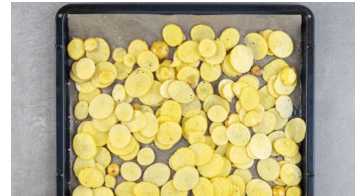
2. Kartoffeln rösten

Den Backofen auf 240°C (220°C Umluft) vorheizen. Die Cranberrys in etwas heißem Wasser einweichen.