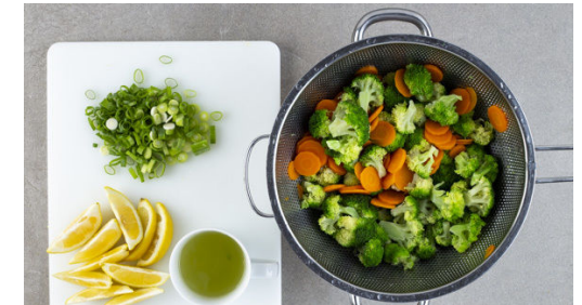
3. Gemüse vorbereiten

Die Kartoffeln samt Schale in max. 0,5cm dünne Scheiben schneiden und auf einem oder ggf. zwei mit Backpapier ausgelegten Backblech(en) mit 2EL Pflanzenöl und 1 kräftigen Prise Salz vermengen. Gleichmäßig verteilen und 15-20Min. im Ofen rösten. In einem großen Topf ausreichend gesalzenes Wasser für das Gemüse zum Kochen bringen.