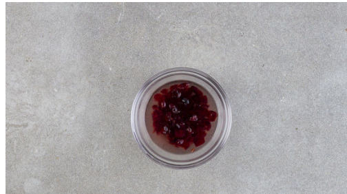
1. Cranberrys einweichen

Energie 838kcal, Fett 31.5g, Kohlenhydrate 87.3g, Eiweiß 44.0g