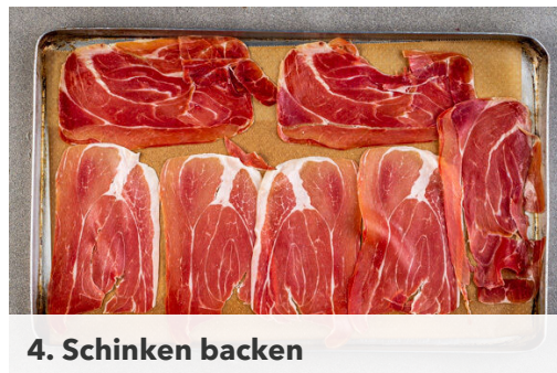
4. Schinken backen

Den Backofen auf 200°C (180°C Umluft) vorheizen. In einem kleinen Topf ausreichend gesalzenes Wasser für die grünen Bohnen zum Kochen bringen. Die grünen Bohnen halbieren, dabei die Enden entfernen. Die Cannellinibohnen in einem Sieb mit kaltem Wasser abspülen und abtropfen lassen.