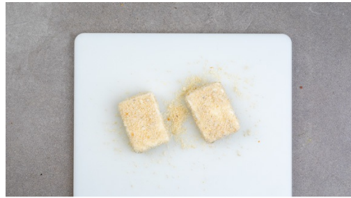
1. Feta panieren

Energie 701kcal, Fett 40.9g, Kohlenhydrate 48.6g, Eiweiß 29.1g