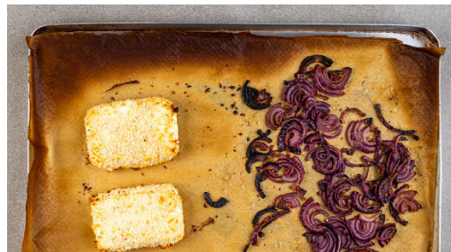
4. Feta backen

Den Backofen mit Grillfunktion oder Ober-/Unterhitze auf 250°C vorheizen. Den Feta halbieren. Die 1/2 des Panko-Paniermehls mit dem Sesam vermengen. 2EL Mehl und 50ml Wasser zu einem zähflüssigen Teig verrühren und mit je 1 Prise Salz und Pfeffer würzen. Den Feta erst durch den Teig ziehen, dann in der Panko-Sesam-Mischung wenden.