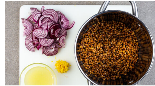
2. Zitrone vorbereiten

Die Zwiebeln mit 1TL Olivenöl und je 1 Prise Salz und Pfeffer vermengen und auf ein mit Backpapier ausgelegtes Backblech geben. Den Feta daneben legen und die Zwiebeln und den Feta im Ofen ca. 5Min. backen, bis die Zwiebeln etwas weicher sind und die Oberfläche des Fetas leicht knusprig ist, dabei nach der Hälfte der Zeit wenden.