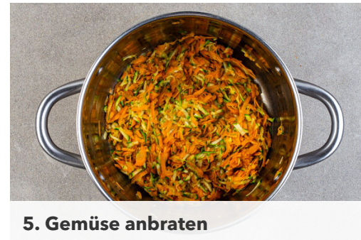
5. Gemüse anbraten

Das Fleisch trocken tupfen und in ca. 1cm große Würfel schneiden. Mit der Gewürzmischung und 2EL Olivenöl vermengen, dann in einer großen Pfanne bei mittlerer Hitze 2-3Min. anbraten. Die Zwiebeln und den Knoblauch dazugeben und 2-3Min. mitbraten.