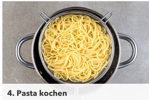
4. Pasta kochen

In einem großen Topf ausreichend gesalzenes Wasser für die Pasta zum Kochen bringen. Die Zwiebel und den Knoblauch schälen, halbieren und in feine Würfel schneiden. Die Petersilie samt Stängeln fein hacken.