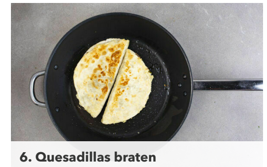
6. Quesadillas braten

Den Lauch in einer großen Pfanne mit 1EL Olivenöl und 1 Prise Salz bei mittlerer bis starker Hitze 3-4Min. weich braten. Dann das Hackfleisch dazugeben und 5-6 Min. krümelig anbraten, kräftig mit Salz und Pfeffer abschmecken.