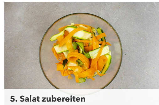
5. Salat zubereiten

Den Joghurt mit 1/2TL Limettenschale , 1EL Limettensaft sowie je 1 Prise Salz und Pfeffer verrühren. Den Dip bis zum Servieren kühl stellen.