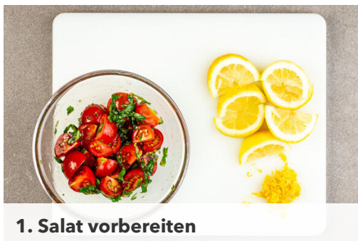
1. Salat vorbereiten

Energie 638kcal, Fett 35.9g, Kohlenhydrate 34.7g, Eiweiß 40.2g