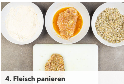
4. Fleisch panieren

Den Backofen auf 220°C (200°C Umluft) vorheizen. Die Kirschtomaten vierteln. Das Basilikum samt Stängeln grob schneiden und mit den Tomaten in eine Schüssel geben. Aus je 1EL Olivenöl und Essig sowie je 1 Prise Salz und Pfeffer ein Dressing anrühren, aber noch nicht mit den Tomaten mischen. Die Zitronenschale abreiben, dann die Zitrone in Spalten schneiden.