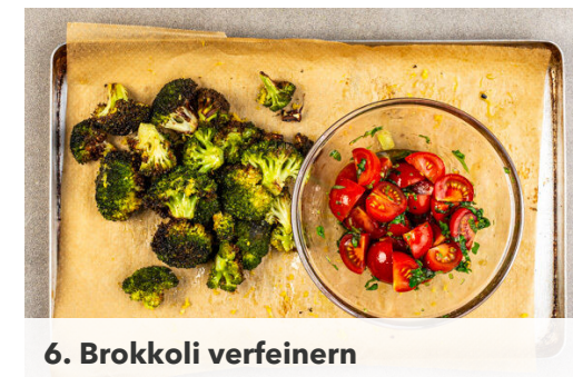
6. Brokkoli verfeinern

Das Fleisch trocken tupfen, horizontal halbieren und zwischen zwei Lagen Backpapier oder Frischhaltefolie z. B. mit einem schweren Topf gleichmäßig ca. 0,5 cm dünn flach klopfen. Von beiden Seiten mit je 1 Prise Salz und Pfeffer würzen.