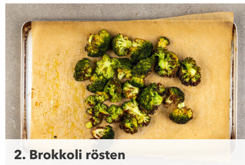
2. Brokkoli rösten

Für die Panade 3EL Mehl auf einen tiefen Teller geben. Auf einem weiteren Teller 1 Ei mit je 1 Prise Salz und Pfeffer verquirlen. Das Panko-Paniermehl mit 1TL Oregano und je 1 Prise Salz und Pfeffer auf einem dritten Teller vermengen. Das Fleisch nacheinander erst im Mehl, dann im Ei und zum Schluss im Panko-Paniermehl wenden.