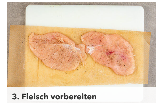
3. Fleisch vorbereiten

In einer großen Pfanne 2EL Olivenöl bei mittlerer Hitze erwärmen. Die Schnitzel in das heiße Öl geben und auf jeder Seite 4-5Min. goldbraun anbraten. Falls die Panade zu schnell bräunt, die Hitze etwas reduzieren.