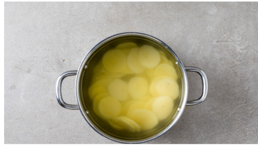
1. Kartoffeln vorkochen

Energie 685kcal, Fett 33.5g, Kohlenhydrate 50.4g, Eiweiß 37.3g