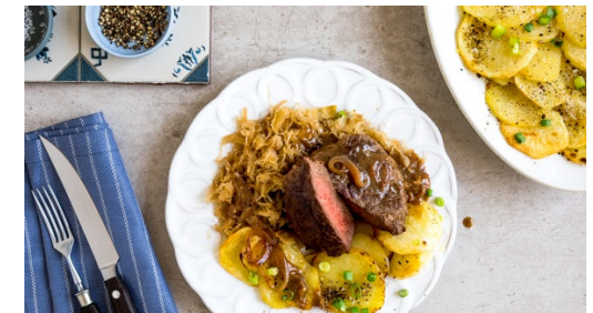
6. Bratkartoffeln zubereiten

Die 1/2 des Sauerkrauts in einem Sieb kalt abspülen und abtropfen lassen, dann in einem kleinen Topf abgedeckt bei mittlerer Hitze erwärmen. Mit Salz und Pfeffer abschmecken und auf kleinster Stufe bis zum Servieren warm halten. Tipp: Wer großen Hunger hat, kann auch das gesamte Sauerkraut verwenden.