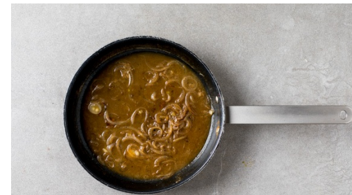
5. Zwiebelsauce kochen

In der Zwischenzeit die Zwiebeln schälen und in feine Ringe schneiden. Die Lauchzwiebel ebenfalls in feine Ringe schneiden.