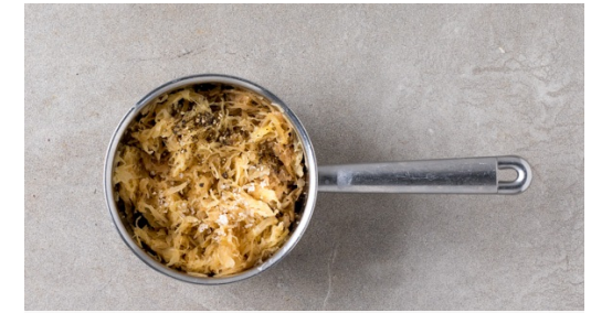
3. Sauerkraut erwärmen

Die Zwiebelringe in derselben Pfanne mit 1EL Pflanzenöl bei mittlerer Hitze 3-4Min. goldbraun anbraten. Mit 2TL Mehl bestäuben und mit 250ml Wasser ablöschen. Die 1/2 des Brühgewürzes unterrühren und die Sauce 3-4Min. bei mittlerer Hitze einköcheln lassen. Das Fleisch dazugeben und bis zum Servieren in der Sauce ziehen lassen.