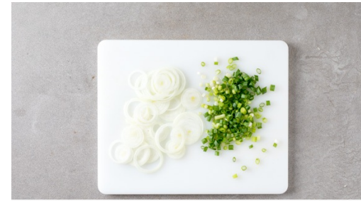
2. Zwiebeln schneiden

Das Fleisch trocken tupfen und horizontal halbieren, dann zwischen Frischhaltefolie legen und mit einem Fleischklopfer oder einer schweren Pfanne leicht plattieren. Mit Salz und Pfeffer würzen. Das Fleisch in einer mittelgroßen Pfanne mit 1EL Pflanzenöl bei starker Hitze auf jeder Seite 1-2Min. scharf anbraten. Aus der Pfanne nehmen und beiseitestellen.