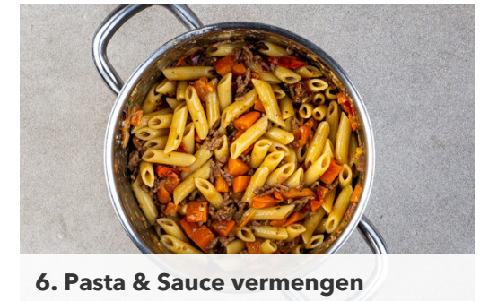
6. Pasta & Sauce vermengen

Die Kirschtomaten halbieren. Den Schnittlauch in ca. 1cm lange Röllchen schneiden. Den Käse fein reiben.