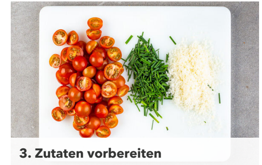
3. Zutaten vorbereiten

Das Hackfleisch in die Pfanne geben und 1-2Min. mitbraten. Die Tomaten , die Feigen samt Wasser und 1EL Essig hinzufügen und abgedeckt bei mittlerer bis starker Hitze in ca. 4Min. weich köcheln. Die Tomaten mit einer Gabel zerdrücken und ohne Deckel weitere 2-4Min. köcheln lassen, bis die Sauce eingedickt ist. Vom Herd nehmen und mit Salz und Pfeffer abschmecken.