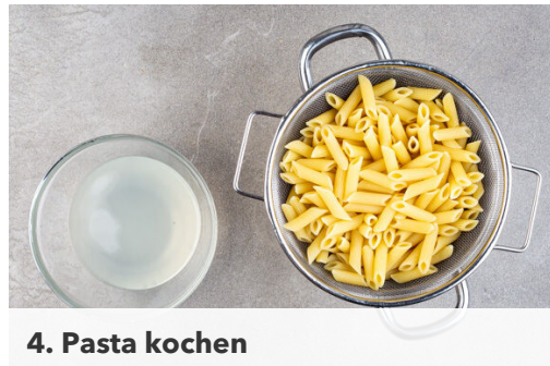
4. Pasta kochen

In einem mittelgroßen Topf ausreichend gesalzenes Wasser für die Pasta zum Kochen bringen. Die Feigen in 100ml heißem Wasser einweichen. Die Karotte ggf. schälen, längs vierteln und in 1-2cm große Würfel schneiden. Die Zwiebel schälen, halbieren und grob würfeln.