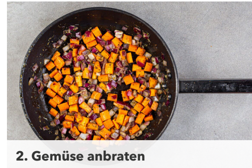
2. Gemüse anbraten

Die Pasta in das kochende Wasser geben und in 8-10Min. bissfest kochen. Ca. 100ml Pastawasser abschöpfen, dann die Pasta in ein Sieb abgießen, abtropfen lassen und zurück in den Topf geben.