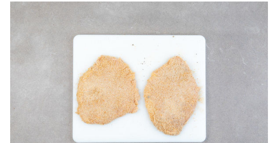
3. Schnitzel panieren

Die Schnitzel in einer großen Pfanne mit 1EL Pflanzenöl bei mittlerer bis starker Hitze auf jeder Seite 2-3Min. braten, bis die Panade goldgelb und knusprig ist. Tipp: Wer mag, kann statt Öl auch 1-2TL Butter verwenden. Die Schnitzel aus der Pfanne nehmen und auf etwas Küchenkrepp abtropfen lassen.