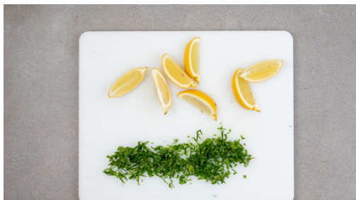
4. Petersilie hacken

Den Backofen auf 220°C (200°C Umluft) vorheizen. Die Kartoffeln samt Schale je nach Größe vierteln oder achtern und auf einem mit Backpapier ausgelegten Backblech mit 1EL Pflanzenöl und je 1 kräftigen Prise Salz und Pfeffer vermengen. Im Ofen 25-30Min. rösten, bis die Kartoffeln goldbraun und knusprig sind.