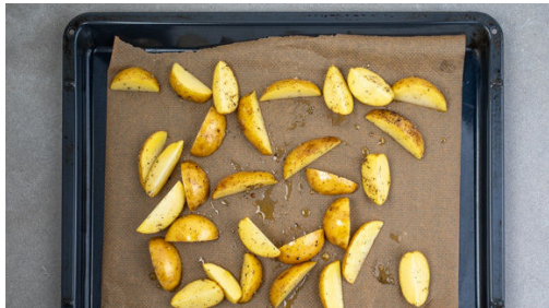
1. Kartoffeln rösten

Energie 778kcal, Fett 40.6g, Kohlenhydrate 59.4g, Eiweiß 43.1g