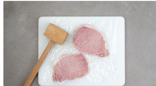
2. Fleisch klopfen

Die Petersilie samt Stängeln fein hacken. Die Zitrone in Spalten schneiden.