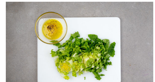
6. Salat zubereiten

Auf tiefen Tellern 1EL Weizenmehl, 1 verquirltes Ei sowie die Semmelbrösel bereitstellen. Die Schnitzel von beiden Seiten mit je 1 Prise Salz und Pfeffer würzen und der Reihe nach im Mehl, im Ei und in den Semmelbröseln wenden. Dabei darauf achten, dass alles gleichmäßig bedeckt ist, und die Panade ggf. noch leicht andrücken.