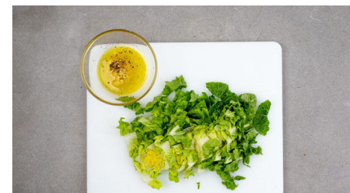
6. Salat zubereiten

Auf tiefen Tellern 2EL Weizenmehl, 1 verquirltes Ei sowie die Semmelbrösel bereitstellen. Die Schnitzel von beiden Seiten mit je 1 Prise Salz und Pfeffer würzen und der Reihe nach im Mehl, im Ei und in den Semmelbröseln wenden. Dabei darauf achten, dass alles gleichmäßig bedeckt ist, und die Panade ggf. noch leicht andrücken.