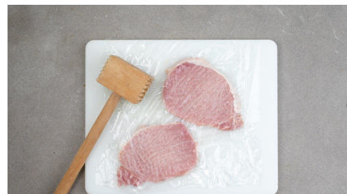
2. Fleisch klopfen

Die Petersilie samt Stängeln fein hacken. Die Zitrone in Spalten schneiden.