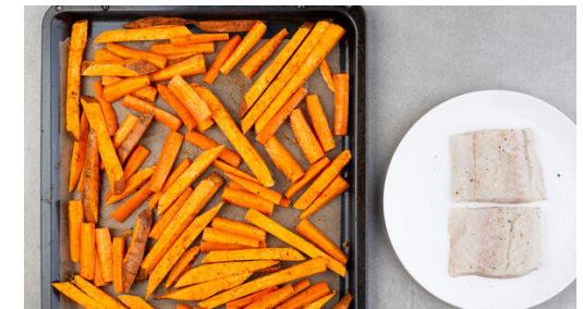
Die Karotten und die Süßkartoffeln auf dem mit Backpapier ausgelegten Backblech verteilen und ca. 10Min. im Ofen backen. Den Fisch mit kaltem Wasser abspülen, trocken tupfen und evtl. vorhandene Gräten mit einer Pinzette entfernen. Den Fisch anschließend mit 1TL Salz und 1 kräftigen Prise Pfeffer würzen.