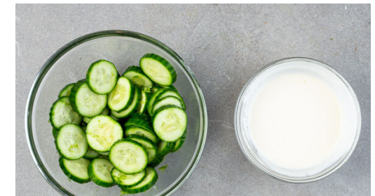
Die 1/2 des Limettensafts mit 6EL Mayonnaise verrühren. Die Gurke in Scheiben schneiden, dann mit dem restlichen Limettensaft , der Limettenschale und 1/2TL Salz vermengen. Den Fisch und das Gemüse aus dem Ofen nehmen, mit dem Gurkensalat auf Tellern anrichten und mit dem Limettendip servieren.