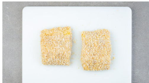
Auf einem zweiten tiefen Teller 4EL Mehl mit je 1 kräftigen Prise Salz und Pfeffer vermengen. Auf einem dritten tiefen Teller 1 Ei mit 2EL Milch verquirlen. Den Fisch zunächst im Mehl, dann in dem Ei-Milch-Mix und schließlich im Panko-Kokos-Mix wenden. Überschüssiges Mehl oder Ei jeweils abschütteln bzw. abtropfen lassen. Die Panade ggf. etwas festdrücken.