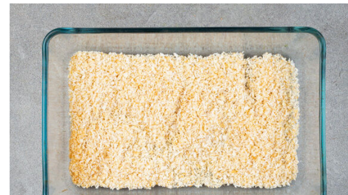
Das Panko-Paniermehl auf einem mit Backpapier ausgelegten Backblech verteilen und 2-3Min. im Ofen rösten. Vorsicht , es kann schnell zu dunkel werden. Das Panko-Paniermehl aus dem Ofen nehmen und auf einem tiefen Teller mit den Kokosraspeln vermengen.