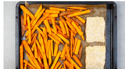
Den Fisch auf einem zweiten mit Backpapier ausgelegten Backblech platzieren, nach ca. 10Min. zu dem Gemüse in den Ofen schieben und 16-18Min. mitbacken. Nach der Hälfte der Zeit die Position der Bleche tauschen.