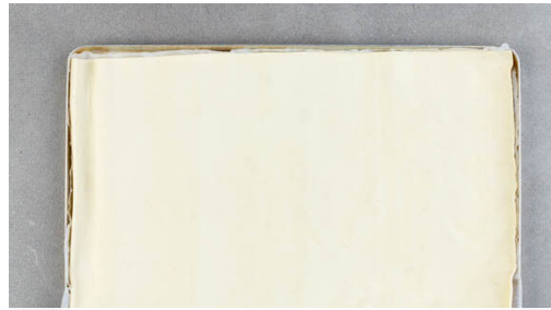
1. Teig ausrollen

Energie 796kcal, Fett 53.1g, Kohlenhydrate 73.3g, Eiweiß 7.7g