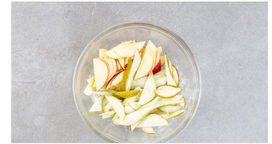
3. Obst vorbereiten

In einem kleinen Topf 6EL Zucker und 2EL Wasser langsam erhitzen, bis der Zucker eine hellbraune Farbe angenommen hat. 100ml Schlagsahne , 50g Butter, 1 Prise Salz und 1 Rosmarinzwig hinzufügen und die Sauce 6-10Min. sanft köcheln lassen, bis sich der Karamell vollständig aufgelöst hat. Den Rosmarinzwig entfernen und die Sauce etwas abkühlen lassen.