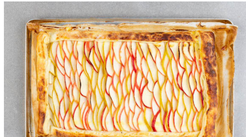
4. Teig belegen

Den Backofen auf 220°C (200°C Umluft) vorheizen. Den Teig mit dem Papier nach unten auf einem Backblech ausrollen. Tipp: Für eine runde oder ovale Galette den Teig entsprechend zuschneiden.