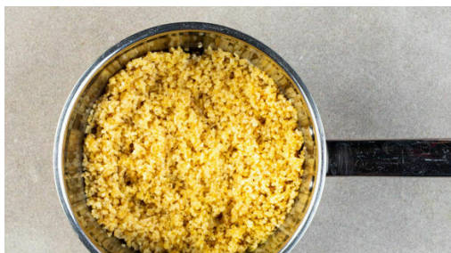
1. Bulgur kochen

Energie 697kcal, Fett 27.9g, Kohlenhydrate 64.0g, Eiweiß 40.5g