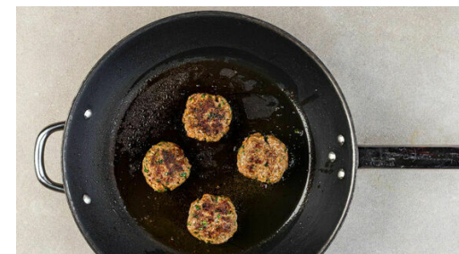
3. Hackbällchen anbraten

1/2TL Brühgewürz mit 130ml heißem Wasser verrühren, mit den Hackbällchen in die Pfanne geben und zum Kochen bringen. Das Gemüse und die Hackbällchen in 4-5Min. gar köcheln, dann mit Salz und Pfeffer abschmecken.