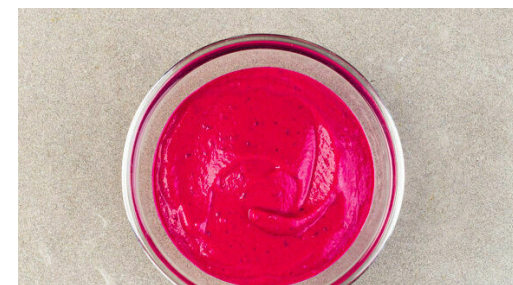
6. Dip pürieren

Das Hackfleisch mit der Gewürzmischung , dem Knoblauch , der 1/2 der Petersilie , 1/2TL Salz und 1 kräftigen Prise Pfeffer vermengen und zu 8 gleich großen Bällchen formen. Die Hackbällchen leicht flach drücken und in einer großen Pfanne mit 2EL Olivenöl bei starker Hitze 1-2Min. auf jeder Seite goldbraun anbraten.