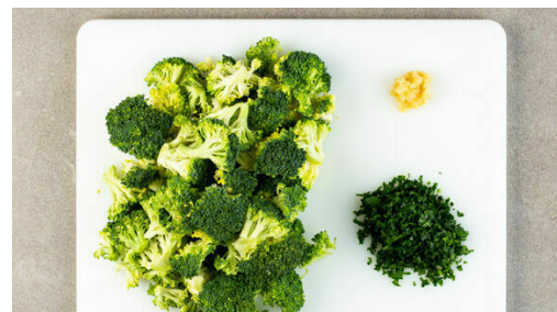
2. Gemüse schneiden

Die Hackbällchen herausnehmen, dann den Brokkoli in die Pfanne geben und bei mittlerer Hitze ca. 2Min. anbraten, dabei gelegentlich rühren.