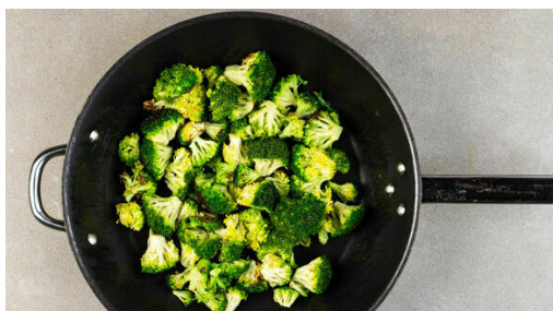
4. Brokkoli anbraten

In einem mittelgroßen Topf 600ml Wasser zum Kochen bringen. Den Bulgur und die 1/2 des Brühgewürzes in das kochende Wasser rühren und abgedeckt bei niedriger Hitze 8-10Min. sanft köcheln lassen, bis das Wasser aufgesaugt und der Bulgur gar ist. Noch ca. 5Min. ohne Hitzezufuhr ziehen lassen. Mit Salz und Pfeffer abschmecken.