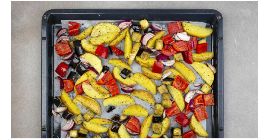
3. Ofengemüse fertigstellen

Die Minzeblätter von den Stängeln zupfen und fein schneiden. Den Joghurt mit der Minze und dem restlichen Knoblauch verrühren und mit Salz und Pfeffer abschmecken.