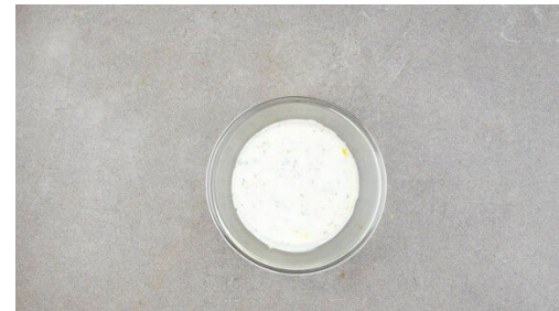
5. Joghurt verfeinern

Die Paprika vierteln, entkernen und in grobe Stücke schneiden. Die Zwiebeln schälen, halbieren und in dünne Spalten schneiden.