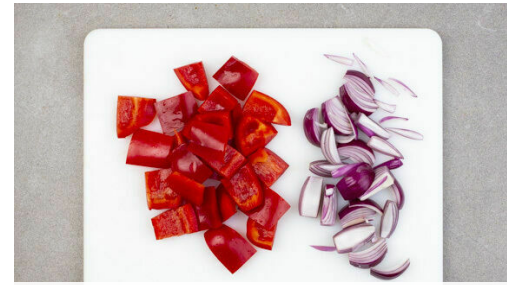
2. Gemüse schneiden

Verzichte auf gedruckte Rezepte - ändere die Einstellungen im Kundenkonto. Fragen zur Zubereitung oder zum Rezept? Deine Koch-Hotline: 030 208 480 510