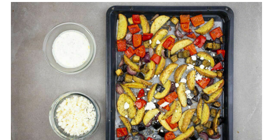
6. Anrichten und servieren

Nach 10-15Min. Backzeit jeweils die 1/2 der Paprika , die 1/2 der Zwiebeln , 1-2TL Provence-Kräuter und 1TL Olivenöl auf den Blechen mit den Kartoffeln und den Auberginen vermengen und das Gemüse noch 10-15Min. backen, bis alles goldbraun und gar ist. Je nach Ofen nach der Hälfte der Zeit die Position der Bleche tauschen.