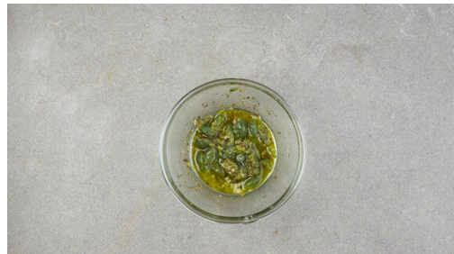
4. Würzöl zubereiten

Den Backofen auf 230°C (210°C Umluft) vorheizen. Die Kartoffeln samt Schale in 1-2cm breite Spalten schneiden. Die Auberginen längs halbieren und in 1-2cm große Würfel schneiden. Die Kartoffeln und die Auberginenwürfel auf zwei mit Backpapier ausgelegten Backblechen jeweils mit 1EL Olivenöl, 1/2TL Salz und 1 Prise Pfeffer vermengen und 10-15Min. im Ofen vorbacken.