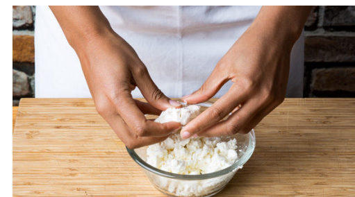
6. Käse zerkrümeln

Die Avocados halbieren und den Kern entfernen. Das Avocadofleisch rautenförmig einschneiden und die Avocadowürfel mit einem großen Löffel aus der Schale lösen. Nach Geschmack mit Salz und Pfeffer sowie 2-3EL Sherryessig würzen.