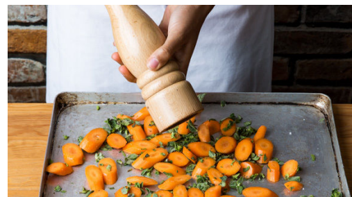
2. Karotten rösten

Den Backofen auf 180°C Umluft (200°C Ober-/Unterhitze) vorheizen. Die Karotten schälen und diagonal in 2-3cm große, mundgerechte Stücke schneiden. Die Petersilienblätter von den Stängeln zupfen und fein hacken.