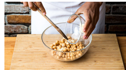
3. Kichererbsen vorbereiten

Die Karotten mit 3-4EL Olivenöl und der gehackten Petersilie mischen und mit Salz und Pfeffer würzen. Auf einem Backblech verteilen und 10-15Min. im Ofen rösten, bis die Karotten leicht gebräunt sind.