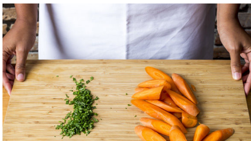
1. Karotten vorbereiten

Energie 565kcal, Fett 39.8g, Kohlenhydrate 29.4g, Eiweiß 19.1g