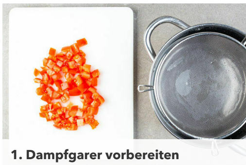
1. Dampfgarer vorbereiten

Energie 825kcal, Fett 42.1g, Kohlenhydrate 74.5g, Eiweiß 35.1g