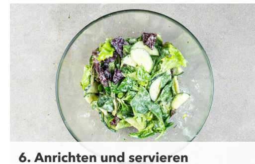
6. Anrichten und servieren

Das Hackfleisch mit Salz und Pfeffer abschmecken. Die Gurken mit dem Wasabi-Dressing vermengen.