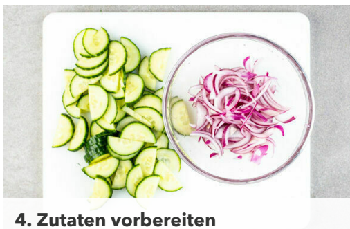
4. Zutaten vorbereiten

Die Korianderblätter von den Stängeln zupfen, fein schneiden und mit der Wasabipaste , 1-2EL Essig und 2EL Mayonnaise zu einem Dressing verrühren. Tipp: Die Stängel einfrieren und das nächste Chili damit verfeinern. Die Hefebrötchen in den mit Backpapier ausgelegten Dampfbehälter geben und ca. 7Min. abgedeckt dämpfen.