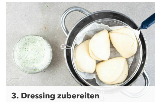
3. Dressing zubereiten

Das Hackfleisch in einer großen Pfanne mit 1EL Pflanzenöl bei mittlerer Hitze in 4-6Min. goldbraun anbraten. Die Tomaten , die Hoisinsauce und 60ml Wasser hinzugeben und bei niedriger Hitze ca. 10Min. einköcheln lassen. Bei Bedarf etwas mehr Wasser hinzufügen.