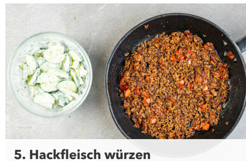
5. Hackfleisch würzen

Die Zwiebeln schälen, halbieren und in feine Streifen schneiden. Die Zwiebeln mit 2EL Essig, 2TL Zucker und 1TL Salz vermengen. Die Gurke längs halbieren und quer in dünne Scheiben schneiden.