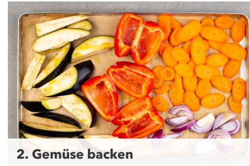
2. Gemüse backen

Die Paprika in grobe Stücke schneiden. Den gebackenen Knoblauch schälen und mit der Paprika , den angerösteten Walnüssen , 1/2TL Paprikapulver , 2EL Olivenöl und 1TL Balsamicoessig in einem hohen Gefäß mit einem Stabmixer cremig pürieren. Mit Salz, etwas Zitronensaft aus den Zitronenspalten und ggf. mehr Paprikapulver abschmecken.