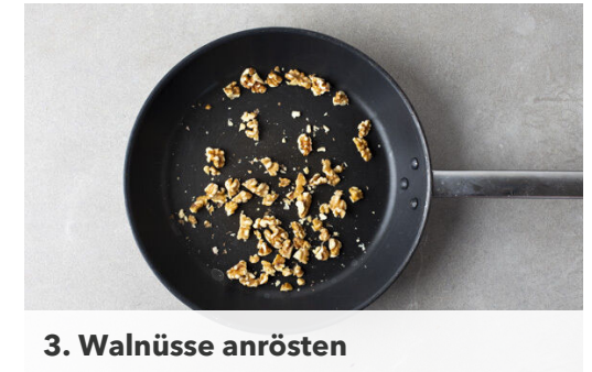
3. Walnüsse anrösten

Die Bohnen in einem Sieb kalt abspülen und abtropfen. Die Zwiebelwürfel und den Knoblauch in einem mittelgroßen Topf mit 2EL Butter, 1/2TL Salz und der 1/2 der Gewürzmischung bei mittlerer bis starker Hitze ca. 2Min. leicht braun braten. Die Bohnen und 100ml Wasser zugeben, bei niedriger Hitze 5–6Min. köcheln. Mit Salz, Pfeffer, Zitronenschale und -saft abschmecken.