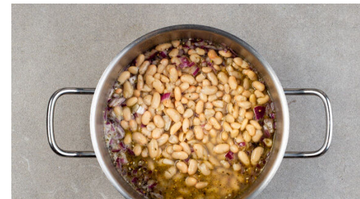
5. Bohnen garen

Die Karotten , die Paprika , die Auberginen , die Zwiebelspalten und 1 Knoblauchzehe samt Schale auf einem mit Backpapier ausgelegten Backblech verteilen, mit 1EL Olivenöl und 1/2TL Salz vermengen und ca. 20Min. im Ofen backen. Die Paprika und den Knoblauch nach ca. 12Min. aus dem Ofen nehmen und abkühlen lassen.