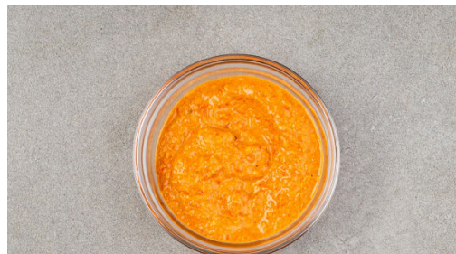
4. Dip pürieren

Den Backofen auf 220°C (200°C Umluft) vorheizen. Die Karotte ggf. schälen und in dünne Scheiben schneiden. Die Aubergine längs halbieren und in ca. 1cm breite Spalten schneiden. Die Paprika vierteln und entkernen. Die Zwiebel schälen und halbieren, eine Hälfte in dünne Spalten schneiden. Die Zitronenschale abreiben, die Zitrone halbieren und in 4 Spalten schneiden.