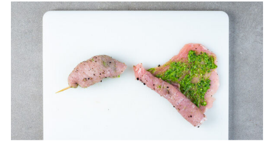
3. Rouladen vorbereiten

Die Aubergine in 1-2cm große Würfel schneiden. Die Paprika vierteln, entkernen und ebenfalls in 1-2cm große Würfel schneiden. Die Tomate grob würfeln. Die Zwiebel schälen, halbieren und in feine Streifen schneiden. Den Knoblauch schälen und fein würfeln.