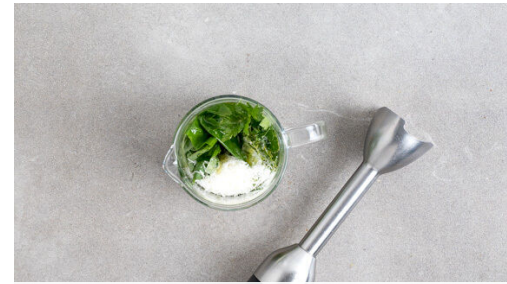
2. Pesto zubereiten

Die Rouladen in einer großen Pfanne mit 1EL Olivenöl bei starker Hitze ca. 2Min. rundum scharf anbraten. Die Rouladen anschließend aus der Pfanne nehmen, in eine Auflaufform geben und im Ofen ca. 8Min. garen, bis das Fleisch gar ist. Die Pfanne aufbewahren.