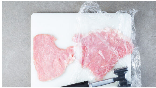
1. Fleisch plattieren

Allergene Milch (7). Kann Spuren von anderen Allergenen enthalten.