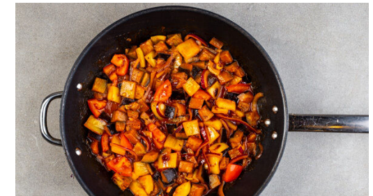
6. Gemüse garen

Das Fleisch gleichmäßig mit dem Pesto bestreichen, aufrollen und mit Zahnstochern fixieren.