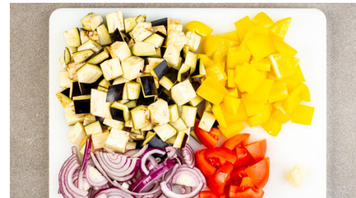
5. Gemüse schneiden

Den Käse fein reiben. Das Basilikum und die Petersilie samt Stängeln grob schneiden und mit dem Käse sowie 2EL Olivenöl in einem hohen Gefäß mit einem Stabmixer zu einem glatten Pesto pürieren. Ggf. noch 1-2EL Olivenöl oder etwas Wasser hinzugeben. Das Pesto mit Salz abschmecken.