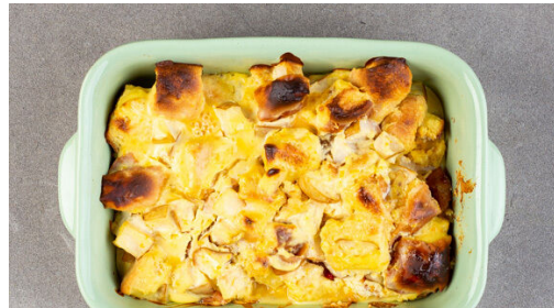
4. Brotpudding backen

Den Backofen auf 200°C (180°C Umluft) vorheizen. Die Brötchen in ca. 3cm große Würfel schneiden. Die Birnen vierteln, entkernen und in ca. 1cm große Würfel schneiden.