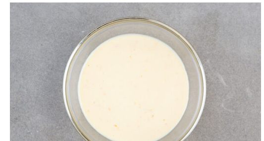
3. Ricotta verrühren

Die übrige Orangenhälfte schälen und das Fruchtfleisch grob würfeln.