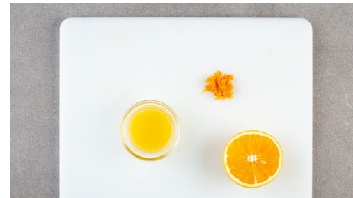
2. Orange vorbereiten

Die Birnen , die Brötchenwürfel und die Ricotta-Mischung gründlich vermengen und in einer kleinen Auflaufform im Ofen 24-30Min. backen, bis der Ricotta gestockt ist. Den Brotpudding mit Alufolie abdecken, falls er zu schnell dunkel wird.