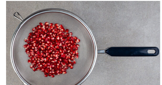
6. Granatapfel vorbereiten

Den Ricotta mit den Eiern , 1TL Orangenschale , dem Orangensaft , 2-3EL Milch , 2EL Zucker und 1 Prise Salz cremig verrühren.