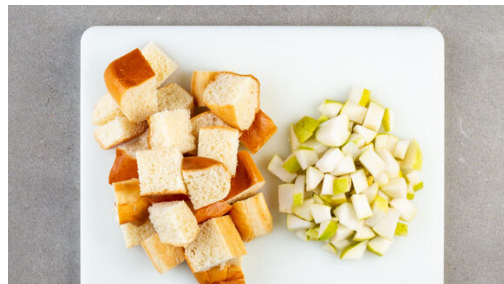
1. Zutaten schneiden

Energie 691kcal, Fett 22.6g, Kohlenhydrate 102.9g, Eiweiß 25.6g