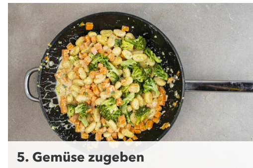
5. Gemüse zugeben

Die 1/2 der Salbeibutter in eine weitere große Pfanne geben und beide Pfannen mittelhoch erhitzen. Die Gnocchi in die Pfannen geben und mit je 1 Prise Salz in 6-8Min. goldbraun und knusprig braten. Den Knoblauch schälen und grob würfeln. Die Zitrone halbieren, eine Hälfte auspressen, die andere Hälfte in Spalten schneiden.