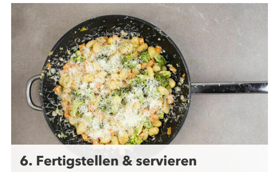
6. Fertigstellen & servieren

Das abgetropfte Gemüse , den Knoblauch und den geschnittenen Salbei zu den Gnocchi in die Pfannen geben und bei mittlerer Hitze unter gelegentlichem Rühren 2-3Min. mitbraten. Die Hitze reduzieren und die Schlagsahne sowie nach Bedarf etwas Kochwasser unterrühren.