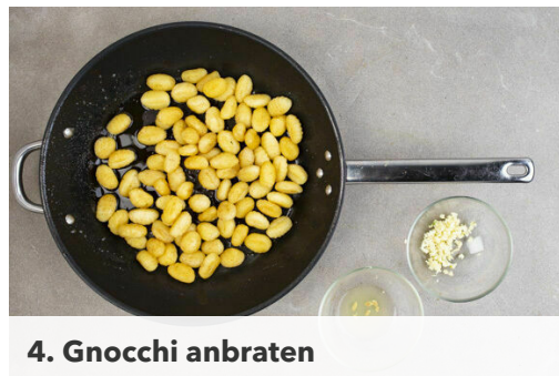
4. Gnocchi anbraten

Den Brokkoli in mundgerechte Röschen schneiden, mit den Süßkartoffelwürfeln ins kochende Wasser geben und in 4-5Min. bissfest kochen. In ein Sieb abgießen und abtropfen lassen, dabei ca. 1 Tasse Kochwasser auffangen.