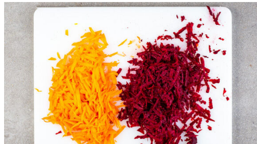
4. Gemüse raspeln

In einem kleinen Topf ausreichend gesalzenes Wasser für die Nudeln aufkochen. Das Fleisch trocken tupfen, in 2-3cm große Stücke schneiden und mit je 1 Prise Salz und Pfeffer würzen. Das Fleisch in einer mittelgroßen Pfanne mit 1EL Pflanzenöl bei mittlerer bis starker Hitze 2-3Min. anbraten, dabei gelegentlich wenden.