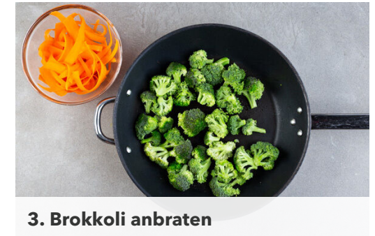
3. Brokkoli anbraten

Die 1/2 des Ingwers fein reiben oder sehr fein würfeln. Tipp: Wer mag, kann auch mehr Ingwer verwenden. Die Erdnussbutter , den restlichen Ahornsirup , das Ketjap Manis , 1EL hellen Essig, 2-3EL heißes Wasser, das Zitronengras und den Ingwer mit einem Schneebesens verrühren und die Sauce mit Salz und Pfeffer sowie ggf. mehr Essig abschmecken.