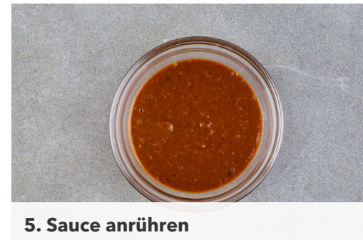
5. Sauce anrühren

Den Tofu in einer mittelgroßen Pfanne mit 1EL Pflanzenöl bei mittlerer Hitze in 5-8Min. rundum goldbraun anbraten. Auf einem Teller beiseitestellen. Das Zitronengras mit 1TL Pflanzenöl in die Pfanne geben und ca. 1Min. anbraten, dann ebenfalls beiseitestellen. Die Pfanne aufbewahren.