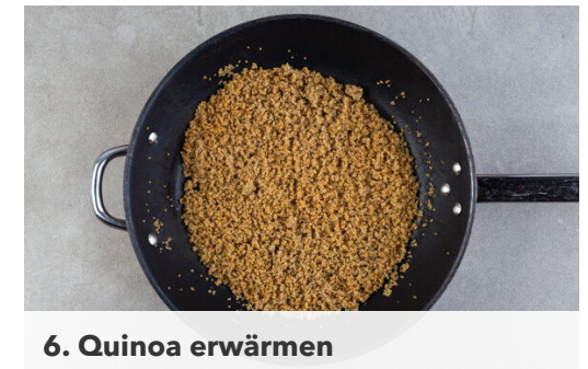
6. Quinoa erwärmen

Die Karotte mit einem Sparschäler in dünne Streifen schneiden und mit 1EL hellem Essig, 1 kräftigen Prise Salz und ggf. 1 Prise Zucker mischen und beiseitestellen. Den Brokkoli in der Pfanne mit 1EL Pflanzenöl bei mittlerer Hitze ca. 1Min. anbraten.