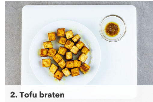
2. Tofu braten

Den Brokkoli mit 100ml heißem Wasser ablöschen und abgedeckt in 2-3Min. bissfest garen. Tipp: Wer den Brokkoli lieber weicher mag, gart ihn 1-2Min. länger. Den Knoblauch schälen, fein würfeln und mit 1 kräftigen Prise Salz und Pfeffer sowie 1/2TL Ahornsirup unter den Brokkoli rühren und 1-2Min. mitbraten.