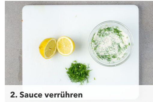
2. Sauce verrühren

Die Brötchen aufschneiden und auf einem mit Backpapier ausgelegten Backblech verteilen. Die oberen Brötchenhälften mit dem Käse belegen, dann alles im Ofen ca. 4Min. backen, bis der Käse geschmolzen ist und die Brötchen knusprig sind.