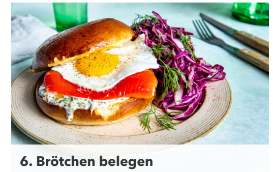
6. Brötchen belegen

Den Rotkohl mit dem restlichen Dill , dem restlichen Senf , dem restlichen Zitronensaft , 2EL Honig und 2TL Salz zu einem Salat vermengen.