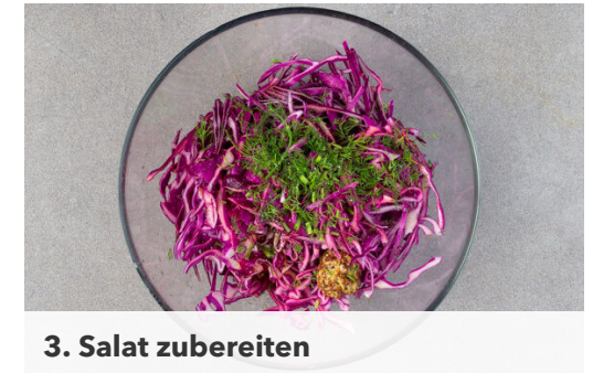
3. Salat zubereiten

In einer mittelgroßen Pfanne 1EL Butter bei mittlerer Hitze erwärmen. Die Eier aufbrechen, in die Pfanne gleiten lassen und in 3–5Min. zu Spiegeleiern braten. Mit je 1 kräftigen Prise Salz und Pfeffer würzen. Tipp: Wer möchte, dass auch das Eigelb fest wird, verwendet einen Deckel.