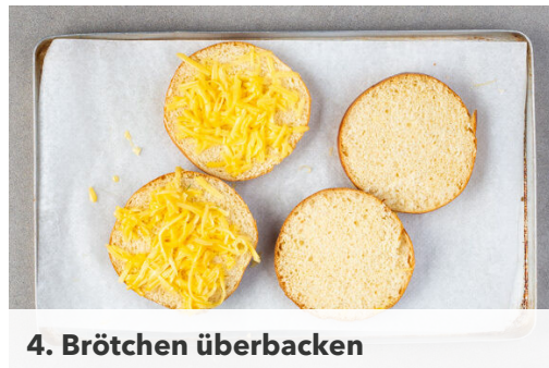
4. Brötchen überbacken

Den Backofen auf 240°C (220°C Umluft) vorheizen. Die Paprika halbieren, entkernen und mit den Schnittflächen nach unten auf einem mit Backpapier ausgelegten Backblech im oberen Teil des Ofens 6–8Min. goldbraun backen. Die Paprika aus dem Ofen nehmen, ca. 5Min. abgedeckt ruhen lassen, dann ggf. die Haut abziehen. Die Backofentemperatur auf 220°C (200°C Umluft) reduzieren.