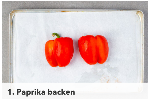
1. Paprika backen

Energie 579kcal, Fett 32.3g, Kohlenhydrate 52.0g, Eiweiß 22.5g