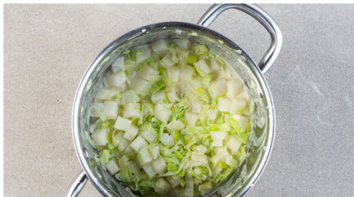
4. Rahmgemüse zubereiten

Die Kartoffeln samt Schale halbieren und in einem mittelgroßen Topf mit leicht gesalzenem Wasser bedecken. Bei starker Hitze zum Kochen bringen, dann abgedeckt bei niedriger bis mittlerer Hitze 15–20Min. kochen, bis die Kartoffeln gar sind.