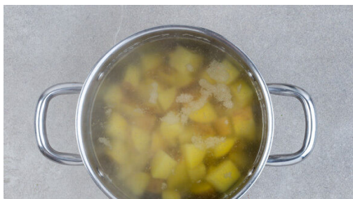
1. Kartoffeln kochen

Energie 739kcal, Fett 36.9g, Kohlenhydrate 55.0g, Eiweiß 38.5g