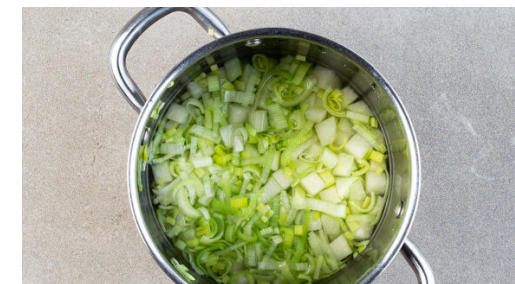
3. Gemüse garen

Das Fleisch trocken tupfen und horizontal zu 2 Schnitzeln halbieren, dann mit je 1 Prise Salz und Pfeffer würzen. In einer mittelgroßen Pfanne mit 1EL Olivenöl bei starker Hitze auf jeder Seite 3–4Min. anbraten, bis das Fleisch gar ist.