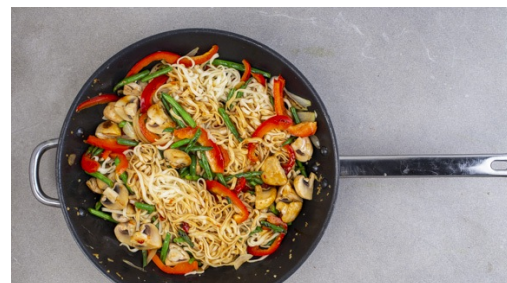
5. Nudeln untermengen

Die Nudeln in das kochende Wasser geben und in 3-5Min. bissfest kochen. In ein Sieb abgießen und abtropfen lassen.