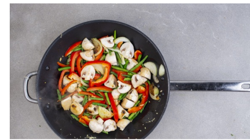
3. Gemüse anbraten

Das Gemüse mit der Würzsauc e ablöschen, dann die Nudeln unterheben, dabei alles gut vermischen und erneut erwärmen. Mit Salz und Pfeffer abschmecken.