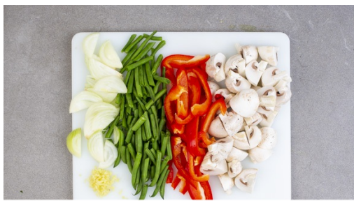
1. Gemüse schneiden

Energie 877kcal, Fett 18.2g, Kohlenhydrate 143.0g, Eiweiß 31.2g