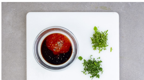
4. Kräuter schneiden

In einem mittelgroßen Topf ausreichend gesalzenes Wasser für die Nudeln zum Kochen bringen. Die Paprika vierteln, entkernen und in dünne Streifen schneiden. Die Bohnen schräg in ca. 2cm große Stücke schneiden, die Enden entfernen. Die Pilze ggf. säubern und vierteln. Die Zwiebel schälen, halbieren und in feine Streifen schneiden. Den Ingwer schälen und fein würfeln.