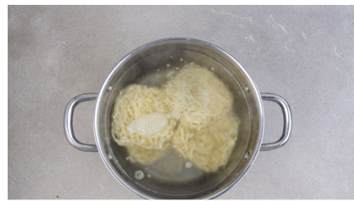
2. Nudeln garen

Die Minzeblätter abzupfen und grob schneiden. Die Korianderblätter von den Stängeln zupfen und grob, die Korianderstiele fein schneiden. 2EL Sojasauce oder nach Geschmack mehr mit der Sweet-Chili-Sauce , dem Ketjap Manis , 1EL Essig, 2EL Wasser sowie Pfeffer zu einer Würzsauce verrühren.