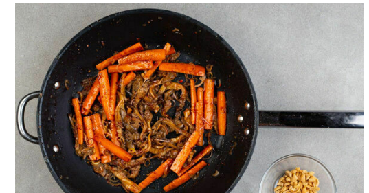
6. Pilzpfanne fertigstellen

Den Limettensaft , die Sojasauce , die Chiliflocken nach gewünschtem Schärfegrad und das Zitronengras mit 2TL Zucker in der Pfanne bei mittlerer Hitze ca. 1Min. erwärmen. Die Pfanne vom Herd nehmen.