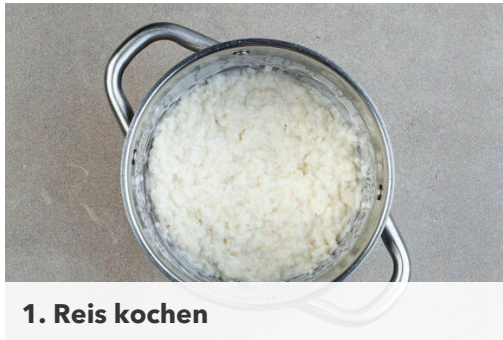
1. Reis kochen

Energie 805kcal, Fett 32.8g, Kohlenhydrate 106.6g, Eiweiß 18.5g