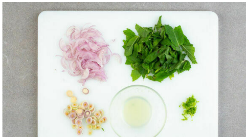
4. Zutaten vorbereiten

Den Reis in einem Sieb kalt abspülen, bis das Wasser klar bleibt. In einem mittelgroßen Topf die Kokosmilch und 400ml Wasser mit 1/2TL Salz zum Kochen bringen, anschließend den Reis hineingeben und abgedeckt bei niedrigster Hitze 10-12Min. kochen, bis die Flüssigkeit aufgesogen und der Reis gar ist. Noch ca. 5Min. ohne Hitzezufuhr ziehen lassen.