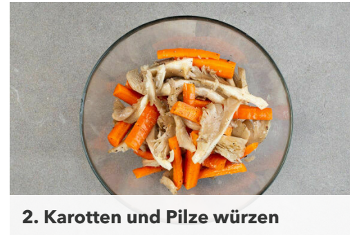
2. Karotten und Pilze würzen

Die oberen 3cm des Zitronengrases entfernen, das übrige Zitronengras in feine Scheiben schneiden. Die Schalotten schälen, halbieren und in feine Streifen schneiden. Die Minzeblätter von den Stängeln zupfen und grob zerteilen. Die Limettenschalen abreiben, dann die Limetten halbieren und auspressen.