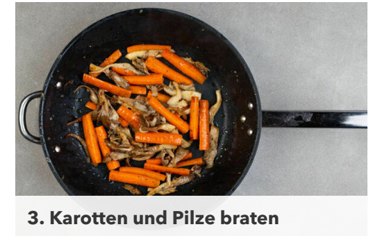
3. Karotten und Pilze braten

Die Karotten ggf. schälen, quer halbieren und in dünne Stifte schneiden. Die Pilze in mundgerechte Stücke zupfen und mit den Karotten , 2EL Pflanzenöl sowie je 1/2 TL Salz und Pfeffer vermengen.