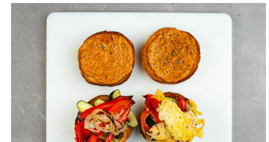
6. Burger belegen

Das Gemüse und den Knoblauch samt Schale auf einem zweiten mit Backpapier ausgelegten Backblech verteilen und mit 2EL Olivenöl und 1 kräftigen Prise Salz vermengen. Die Würste zwei- bis dreimal mit einer Gabel oder einem Messer einstechen und auf das Gemüse legen.