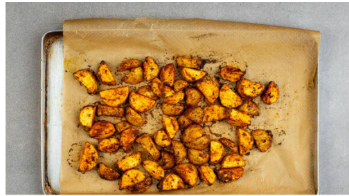
1. Kartoffeln backen

Energie 993kcal, Fett 59.9g, Kohlenhydrate 82.1g, Eiweiß 33.5g