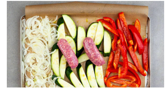
3. Gemüse vorbereiten

Den Knoblauch aus der Schale drücken und mit 6 Paprikastreifen , 5 Zwiebelstreifen , dem Paprikapulver , 4EL Mayonnaise und 2EL Essig in ein hohes Gefäß geben. Das Basilikum samt Stängeln grob schneiden, ebenfalls in das Gefäß geben und alles cremig pürieren. Die Sauce mit Salz und Pfeffer abschmecken.