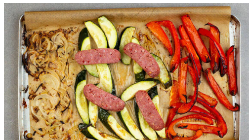
4. Gemüse und Würste backen

Den Backofen auf 240°C (220°C Umluft) vorheizen. Die Kartoffeln samt Schale längs halbieren und quer in ca. 2cm große Stücke schneiden. Die Kartoffeln mit dem Bratkartoffelgewürz , 2EL Olivenöl und 1/2TL Salz vermengen und auf einem mit Backpapier ausgelegten Backblech im Ofen 20-25Min. goldbraun backen.